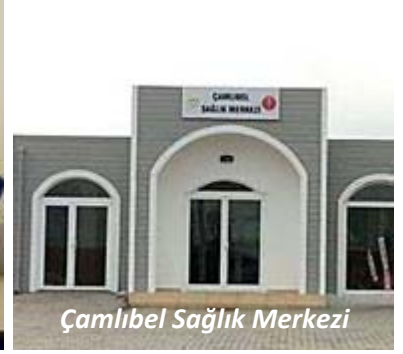
Çamlıbel Sağlık Merkezi

112 Acil Sağlık servislerine bağlı ambulansların yurt içinde hastaya ulaşma süresi ise en fazla 15 dakikadır.