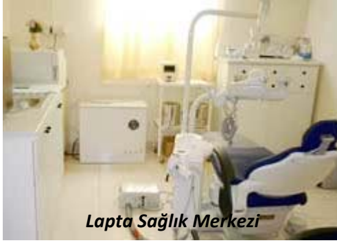
Lapta Sağlık Merkezi