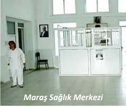
Maraş Sağlık Merkezi